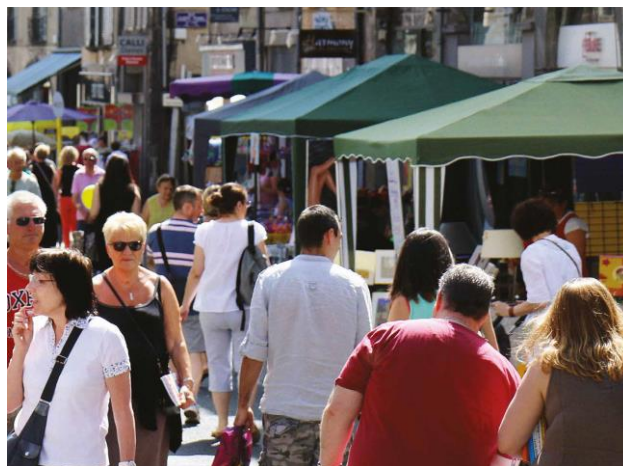
© J. Chabanne et A. Hébrard