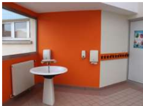
Hall d'entrée du restaurant