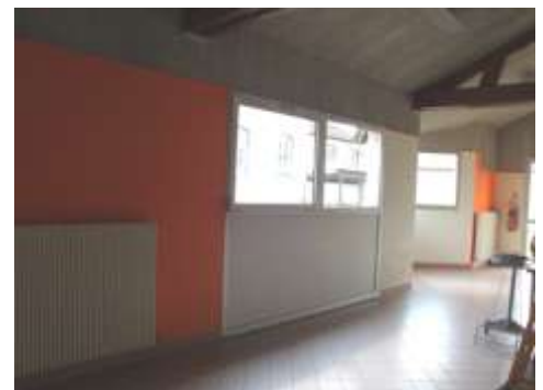
Salle de restauration