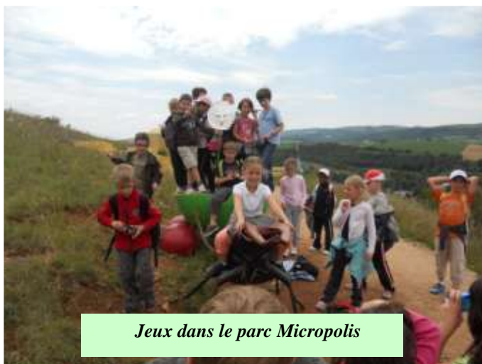
Jeux dans le parc Micropolis

Les élèves de CM2, quant à eux, visitèrent le musée de la résistance à Lyon et furent particulièrement touchés par le témoignage d'une ancienne déportée. Leur sortie s'acheva au cœur des ruines gallo-romaines à Fourvière.