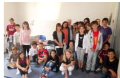
Rencontre avec une ancienne déportée

Deux mois de calme en été, et notre cour se met à nouveau à résonner des rires, cris, courses et bousculades de 166 élèves répartis en 7 classes cette année.