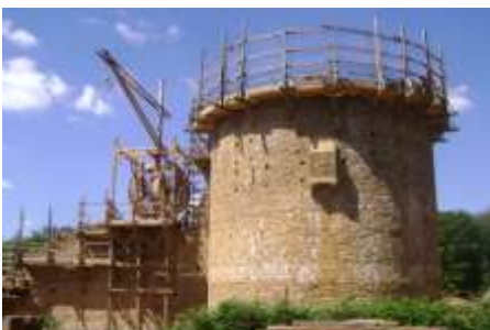
Château de Gudeleon en construction

La cour de l'école publique fut moins animée les deux derniers jours de l'année scolaire ... Les classes de CE2 et de CM1 étaient en effet parties visiter le chantier de Guedelon, château en cours d'édification selon les techniques du XII ème siècle. S'ensuivirent une balade nocturne illuminée dans les ruelles de Bourges et un réveil matinal embrumé au muséum d'histoire naturelle de la ville. Les élèves achevèrent leur périple par la recherche d'un mystérieux manuscrit caché au sein de l'abbaye de Noirlac. Art roman, art gothique, architecture médiévale furent les notions initiées lors de ce projet de deux jours.